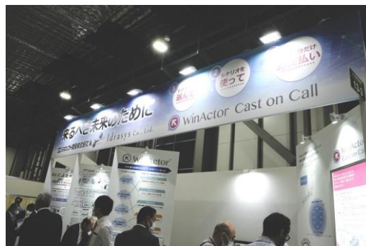
過去の出展の様子

単純な伝票処理から複雑な作業までを正確に“再現”。人が行うパソコン業務をロボットが全て請負い、業務効率を改善します。日本ソフト開発独自の導入支援サービスにより、効果的な業務自動化を支援します。