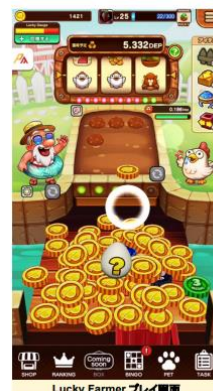
Lucky Farmer プレイ画面