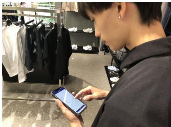
店舗内でのJAN8 CS入力の様子