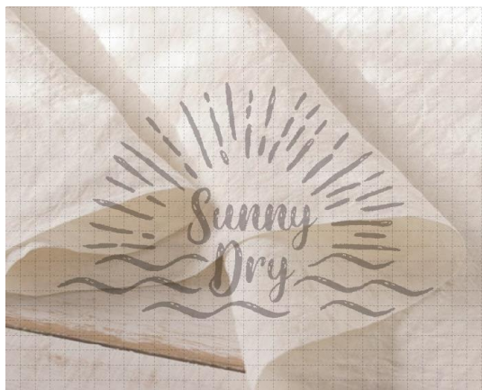
TENPIBOSHI × ECLECT / Slacks Pants 然(ぜん)