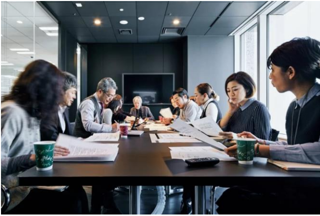
ホテルや商業施設、店舗、公共施設などの内装はここから生まれる