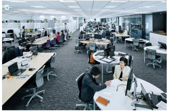
広く開放的な丹青社のオフィス