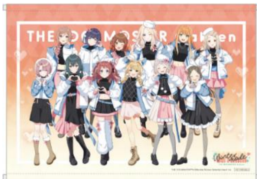
B2タペストリー (全1種)