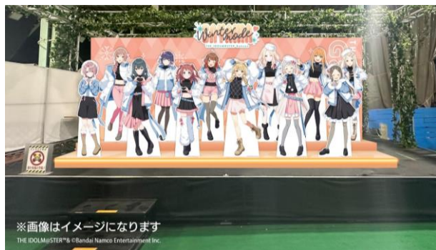
※画像はイメージになります