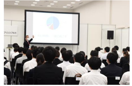
過去のセミナー開催イメージ