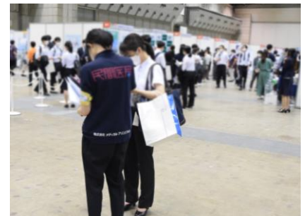
ブース訪問サポーター

病院探しに困ったら、病院情報のスペシャリスト「ブース訪問サポーター」に、個別にご相談できます。