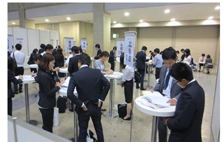
医学生キャリアなんでも相談コーナー

※病院のご案内については、ブース訪問サポーターでも承りますので、お気軽にご利用ください。