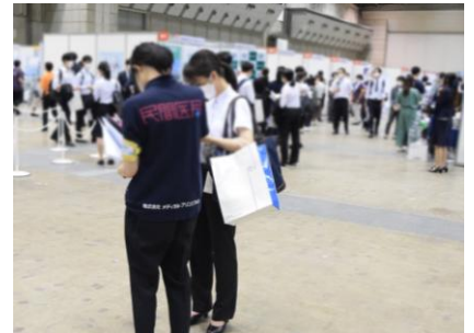
ブース訪問サポーター

参加者限定特典として、臨床研修指定病院496施設の情報網羅されたレジナビBook2025年版を、会場内の「医学生キャリアなんでも相談コーナー」にて15時より配布いたします。