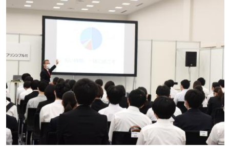
過去のセミナー開催イメージ