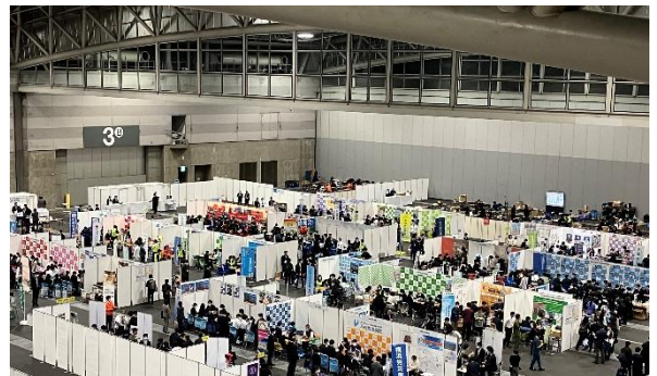
「レジナビフェア2025名古屋」の様子