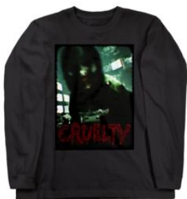
ロングスリーブTシャツ