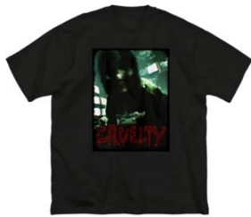
ビッグシルエットTシャツ 4,730円(税込) https://bit.ly/4hJxi1L