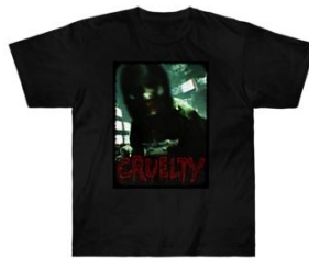
ヘビーウェイトTシャツ 4,140円(税込) https://bit.ly/40ZAxg3