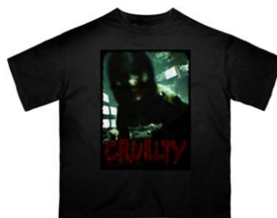
オーバーサイズTシャツ