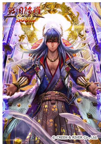
上杉謙信 毘沙門天