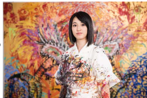
『Phoenix Reborn』(Sony Xperia CM ライブペイント作品)