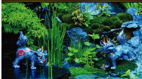
『MIWA KOMATSU WORKS』表紙