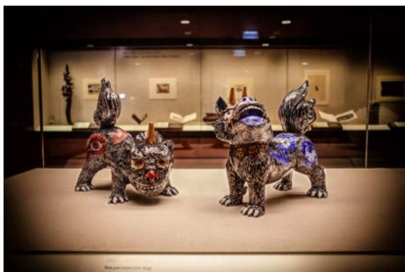
『天地の守護獣』(有田焼:大英博物館収蔵作品)