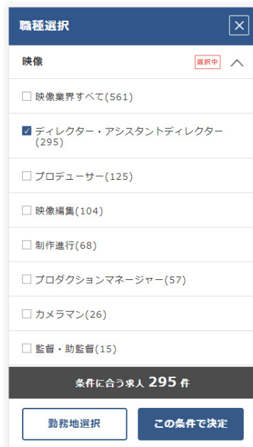
CREATIVE JOB TOPページ(スマホ)