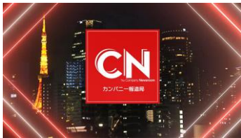
カンパニーニュース

動画による社内コミュニケーションの中心(視聴者)は社員です。企業や経営サイドが発信する情報をわかりやすく噛み砕き、いかに興味深く見てもらうかが鍵となります。カンパニー報道局の多彩な番組フォーマットを利用することで、経営層と従業員のコミュニケーションをスムーズに行うことができます。