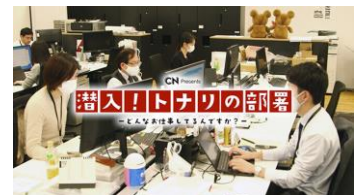
潜入！トナリの部署