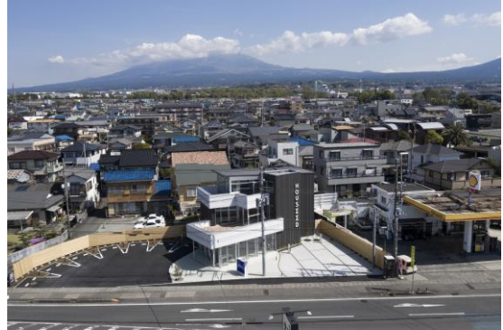
新本社と富士山