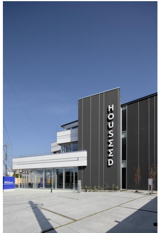
新本社外観