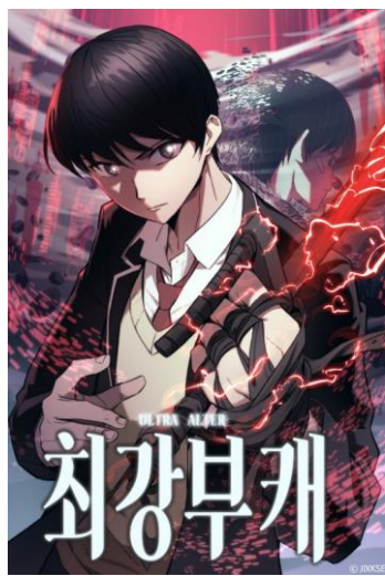
韓国版 (NAVER WEBTOON)