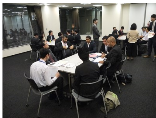
各企業のテーブルで個別説明・面談

当社は、1990年の設立以来、クリエイター、ITエンジニア、医師、弁護士、会計士、建築士、ファッション、シェフなどのエージェンシーを立ち上げてまいりました。プロフェッサー・エージェンシーは、当社理念である「プロフェッショナルの生涯価値の向上」と「クライアント企業の価値の創造」を実現するための「知」の分野を網羅しております。当社グループは今後、50分野にエージェンシー事業を展開し、「プロフェッショナルによる豊かな社会の実現」に貢献してまいります。