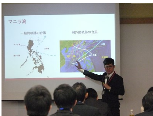
研究者留学生が一人ひとり実績をアピール

2016年10月19日(水)19:00から 株式会社クリーク・アンド・リバー社本社ホールにて開催