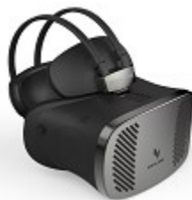
アイデアレンズ K2 プラス

VR体験に匂いを加えるデバイス(2018年発売予定)。 VRコンテンツのアクションやシーンに連動して、体験者に匂いを感じさせることが出来る。サイズ:横120mm×高15mm×幅35mm。 重さ50g、バッテリーは2時間。匂い搭載数は5種類(今回展示のプロトタイプは3種類設定)。匂い持続期間は1ヵ月。