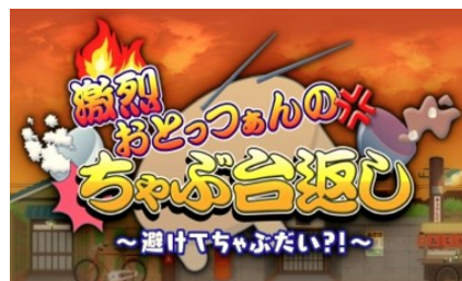
「激烈おとつあんの ちゃぶ台返し」

「アイデアレンズK2プラス」は、当社及びVR分野の子会社 株式会社VR Japanより発売しております。詳細は2枚目に。