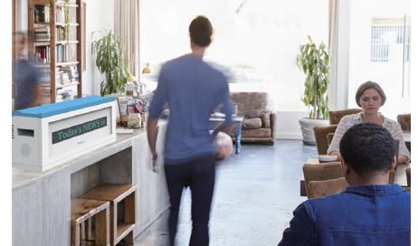
▲宿泊施設のフリースペースに