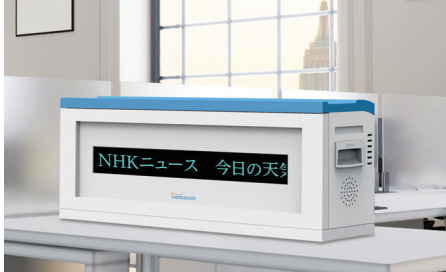
▲職員室のデスクに