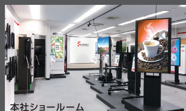
本社ショールーム