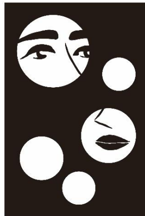
Scene 2. SECRET PHOTO STUDIO