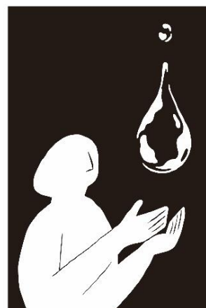
Scene 3. SCENT OF EMOTION

実はこの香り、ポーラの製品をイメージさせる香り。思いがけない接点で、ポーラの製品に触れる。