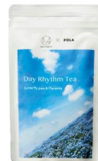
デイリズムティー セレクトボックス リミテッドエディション

ハニーブッシュ&セラミド 2g×14包 バタフライピー&プラセンタ 2g×14包 ¥3,996（税抜 ¥3,700）