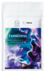
フェムグレス リミテッドエディション

60粒 ¥3,996（税抜 ¥3,700） 180粒 ¥10,800（税抜 ¥10,000）