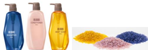
※アメニティの容器を粉砕し、リサイクルパズルに