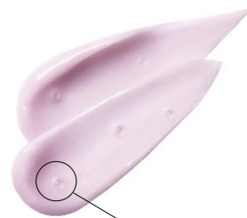
アーモンドオイルを 内包したカプセル

シंकエキスや、アーモンドオイルを内包したカプセルを密着クリームに閉じ込め、 毛穴※に絡みとどまるテクスチャーで 頭皮・髪の汚れを落とし、すこやかに保ちます。