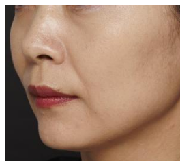
B.A デイ プランプ ファンデーションで化粧直し後