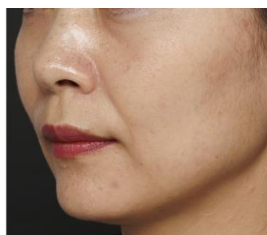
ベースメイクが崩れた状態