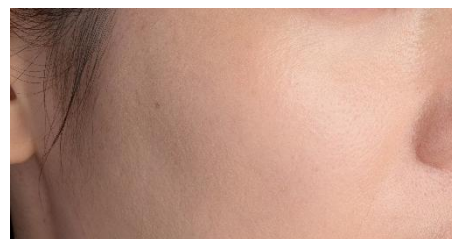
B.A デイ プランプ ファンデーション (色号数：P2) 塗布

※1：メーク効果による ※2：ポーラ B.A クリーム 7 ※3・4：色号数N3での自社従来品比