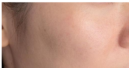
自社従来品 (色号数：P2) 塗布