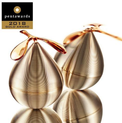
2017年10月発売 V リゾネイティッククリーム

『これからの「美」は個人の外見や内面にとどまらず周囲にも、ポジティブな影響を与えるもの』というブランド思想に基づき、揺れる要素を取り入れ、周囲と響き合う「共鳴」を表現したデザイン。