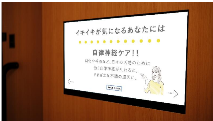
「からだバランスチェック」イメージ

Trimが掲げる“すべてのお母さんを幸せにする”という考えに共感したことがきっかけとなり、コンテンツ開発共創パートナーとしてそれぞれの知見や強みを活かしながら、育児に関わるすべての人を応援したい、すべてのママが自分らしく健やかに生きる世界を実現させる取り組みとして、スタートいたしました。育児に関わる全ての人が、もっと自分らしく社会とつながり、もっと楽しむことで、豊かな未来をつくりたいと考えます。