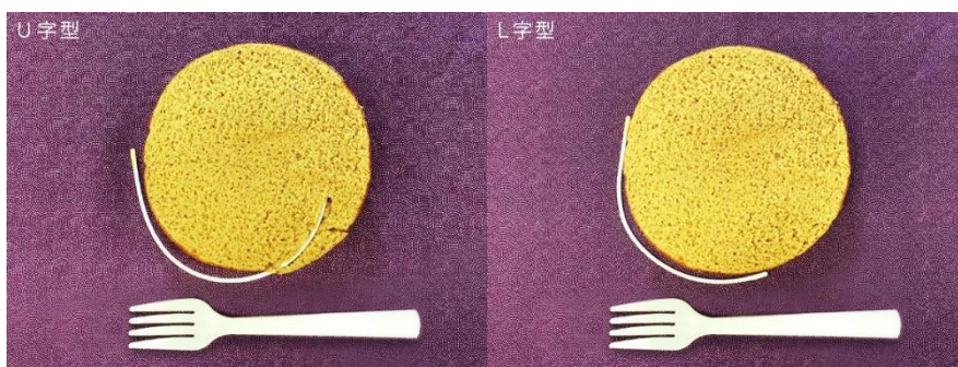
左：一般的に使用されている「U 字タイプワイヤー」 右：「ドレスイージーブラ」に使用されている「L 字タイプワイヤー」

「ドレスイージーブラ」で使用されているのは、前中心が低い L 字タイプワイヤー。脇はしっかりホールド、前中心は圧迫感がなく、ストレスフリーな着け心地です。