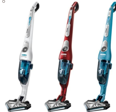
グロッシーレッド (TY886384)

応募内容を確認の上、3,000円分のJCBギフトカードを郵送します。 （特定記録郵便（投函履歴付き）を使用。応募受付後、約1カ月程度での発送を予定）