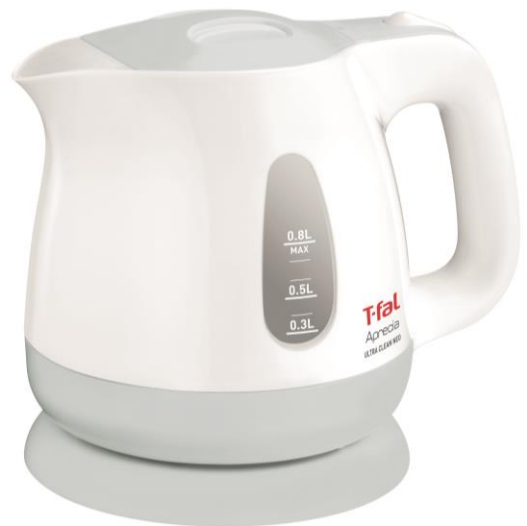
シックで落ち着きのある 〈マットグレイ〉