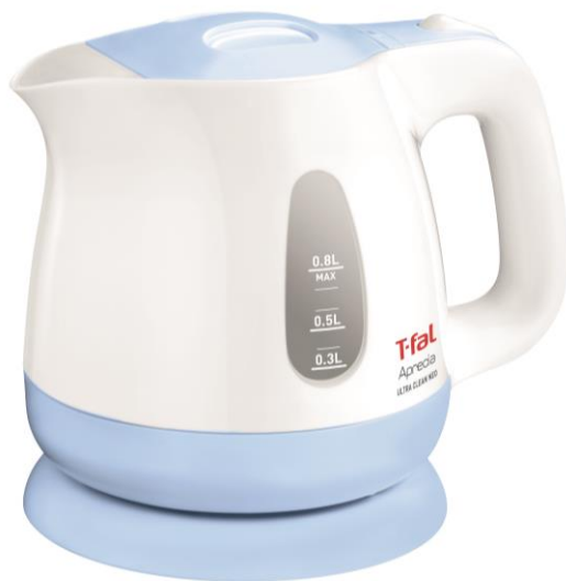
爽やかで清涼感あふれる 〈スカイブルー〉

*1 2005年1月～2014年12月(120ヶ月連続)「電気ケトル」メーカー別販売数量・販売金額シェア 2005年1月～2010年12月全国有力家電量販店の販売実績/GfKJapan調べ 2011年1月～2014年12月販売実績を基に推計した国内市場規模データ/GfKJapan調べ