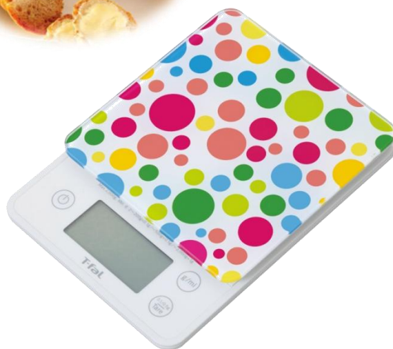
オプティモ ガラストップ バブル