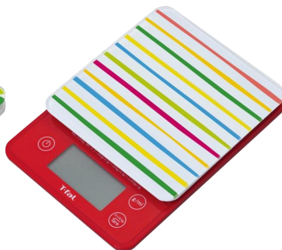
オプティモ ガラストップ ストライプ