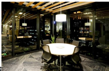
大阪 事業構想大学院