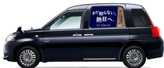
車窓投影イメージ

「FC 東京 熱狂タクシー」は、チームの情熱と選手の新たな挑戦への想いを乗せた、2025 シーズンの開幕を盛り上げる特別企画です。タクシー100 台のうち 5 台の車両は、今回のプロモーションメッセージである「まだ知らない、熱狂へ。」というメッセージとクラブカラーである青と赤を車体にラッピング。残り 95 台は、モビリティ車窓メディア「Canvas」を活用し、タクシーの車窓にキービジュアルを投影します。