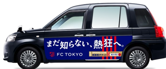
ラッピングイメージ

合計 100 台の「FC 東京 熱狂タクシー」では、車内のサイネージで FC 東京の選手の素顔をお届けする企画コンテンツや、長友佑都選手らが出演する新しいユニフォームの PV 映像など、合計 10 種類の映像からユーザーが好きなコンテンツを選択し視聴可能なほか、FC 東京のホーム開幕戦チケットが 1,000 組 2,000 名に当たるキャンペーンも告知します。「FC 東京 熱狂タクシー」は、1 月 20 日よりタクシーアプリ「S.RIDE」にて指定配車することが可能です。(特定の車両指定は不可)FC 東京の 2025 シーズンを盛り上げる特別なタクシーに是非ご乗車ください。