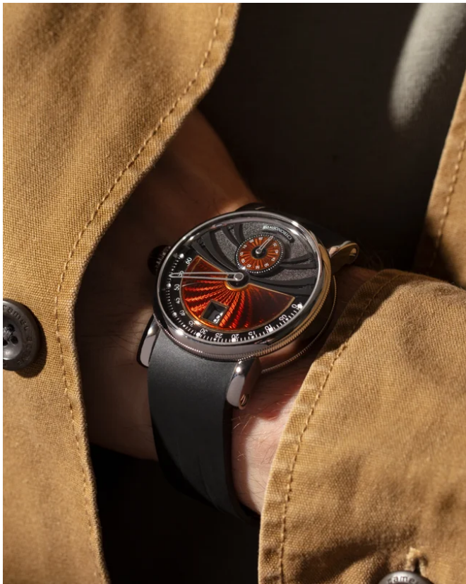
デルフィス デューン CH-1423T.1E-BKMA