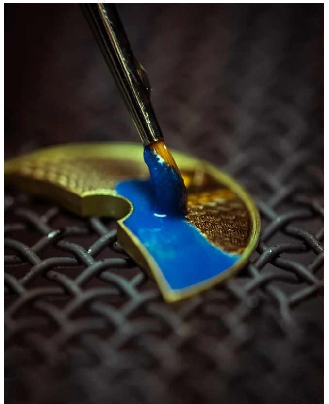
デルフィスの文字盤は曲面のため、均一にエナメルを塗るにはより高度な技術が必要

デルフィスの文字盤は曲面のため、均一にエナメルを塗る作業はより高度な技術が必要です。一度でも失敗すればやり直しになるので、完璧な作業が求められます。