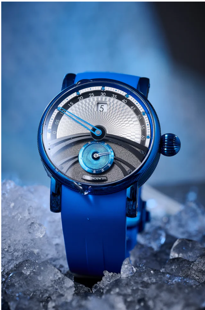
デルフィス サブゼロ CH-1426.1-BKSI