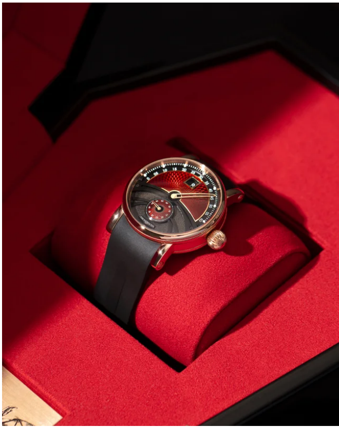
デルフィス ドラキュラ CH-1421.1E-BKRE