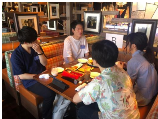
相 TALK の様子(就活生)

『相 TALK』は接客やチームワークで求められるコミュニケーション能力を審査する体験型選考会で、当日は男子9人、女子4人が参加し、2回の相席トークに臨み、即戦力となりうるコミュニケーション能力を持った学生3名にその場で内定証書を授与しました。