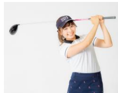
ラウンドリポーター:なみき氏

さらに、大会当日は大物サプライズゲストも登場予定！！ 1日を通してシミュレーションゴルフの白熱の戦いをご堪能ください。