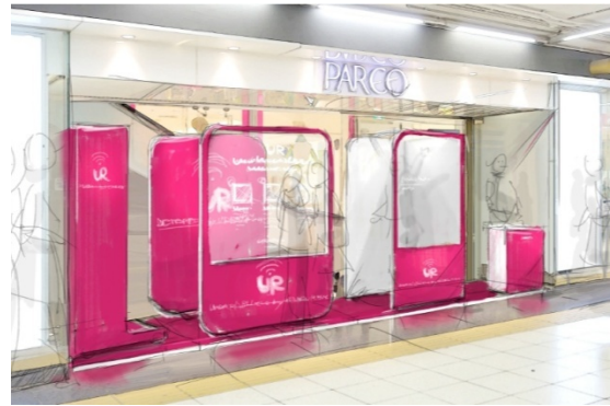
池袋パルコ本館地下1Fに設置される 「ウェアラブル クロージング バイ アーバンリサーチ」

端末はアーバンリサーチのECサイトと連携しているため、気に入った商品があれば液晶画面上でECサイトのカートに入れ、発行されるQRコード(※)にスマートフォンからアクセスすると、そのまま購入することができます。さらに、フィッティング画像を自分のSNSに投稿することができるため、試着している様子を友達にシェアすることが可能です。このようにバーチャルフィッティングから購入までを1台で実現し、SNSとの連携機能を搭載している端末はアパレル業界初となります。(※QRコードは株式会社デンソーウェブの登録商標です)