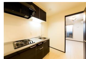
1棟新築木造アパート『Z-MAISON』