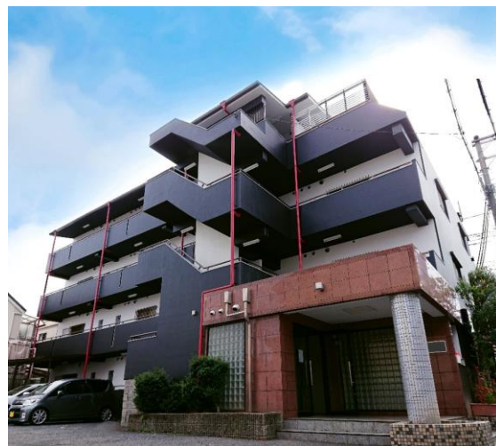
中古リノベーション物件『Z-RENOVE』

〈Z-MAISONブランドページ〉 https://yamatozaitaku.com/z-renov/