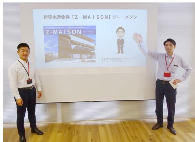
社内公募によって決定

ブランド名の頭文字にはアルファベットの『Z』がつけます。これはアルファベットでZの次は無いことから、「これ以上の物は他に無い、最高の物」という意味です。