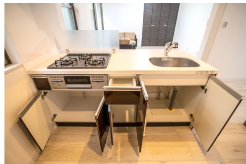
開放的な収納スペース

利便性にもこだわり、天板は85～90cmと十分な奥行きをとり、サイズによってガスコンロは2口又は3口設置します。また、本体の内側は全面収納スペースとなっている為食器やキッチン雑貨を沢山しまふことができ、キッチン回りもすっきり片付きます。