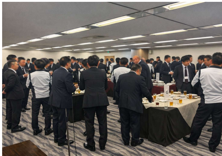
< 懇親会の様子 >

当社は今後も、事業を通して顧客・取引先・社員の人生の潤いをどこまでも高め続けます。そして日本国・世界各国のさらなる発展に貢献し、潤いを環(まわ)し続けられるよう誠心誠意取り組んでまいります。