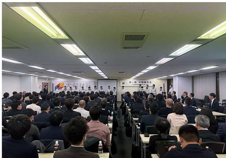
< 中間報告の様子 >