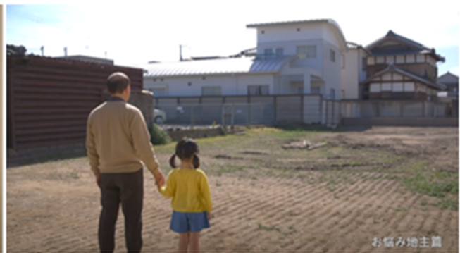
(左) お悩み経営者篇 (右) お悩み地主篇