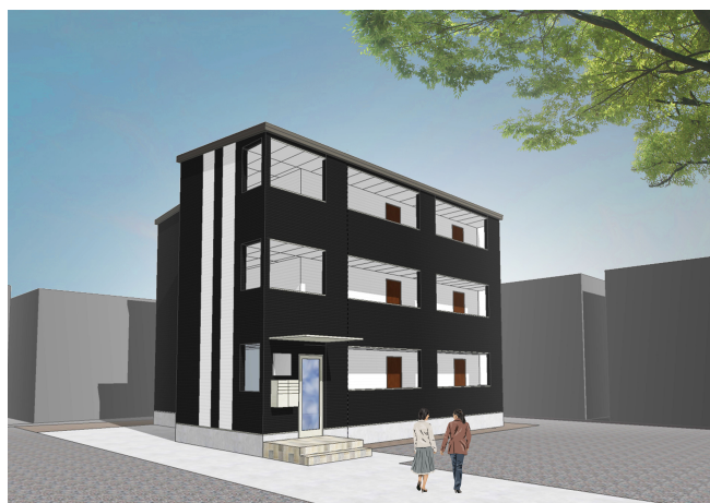
今回の内覧会対象の物件イメージ