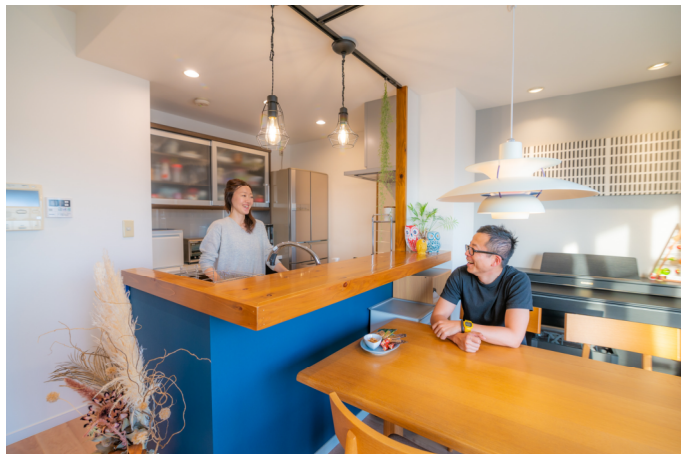
当社のリフォーム事例

当社は資産運用コンサルティング事業を展開しており、資産運用のメインツールとして新築・中古の1棟収益不動産を活用しています。自社に建築・リフォームチームを擁し、これまで多くの収益不動産開発・リノベーションを手掛けてまいりました。そしてこの度、これまで培ったノウハウを以て実需不動産のリフォームサービスを開始しました。