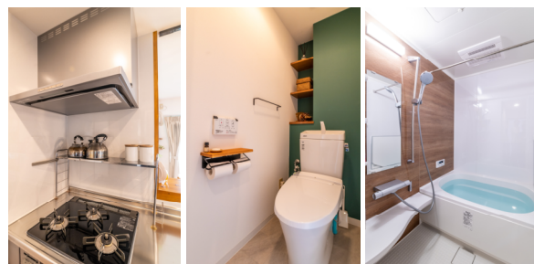
リビング、キッチン、トイレ、バス等を全面リフォーム

<やまとのリフォーム> https://yamatozaitaku.com/reform/