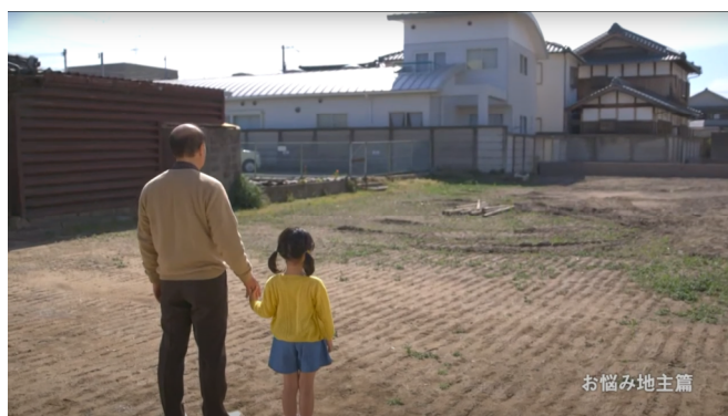
(左) 『お悩み経営者篇』 (右) 『お悩み地主篇』