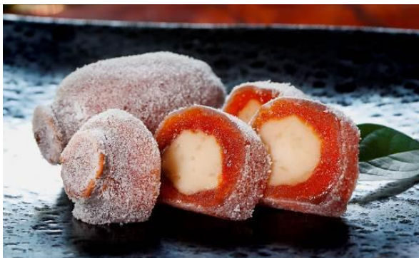
宗家 源 吉兆庵の代表菓子「自然シリーズ」の「粹甘肅」（1 個 540 円／税抜）

銀座本店オープン日には、テープカットも開催。また、2,000 円（税抜）以上お買い上げの方に数量限定で「THE HOUSE オリジナルトートバッグ」をプレゼントいたします。今後も国内外から多くの人が集まる銀座で、和菓子を通じて日本文化を伝えていきます。