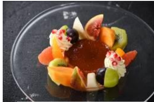
「プリンアラモード」