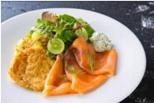
「じゃがいものガレットとスモークサーモンマスカットサラダ」