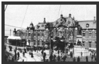
1912(明治45)年初代駅舎

かつて日本有数の繁華街として文化や情報、知、技術が集積し、地域のランドマークとなっていた旧万世橋駅。マーチエキュート神田万世橋は、中央線の起終点として1912年（明治45年）に開業した旧万世橋駅の鉄道遺構をリノベーションした商業空間です。2013年9月に約100年の時を経て人々の集う施設としてよみがえりました。レンガ高架橋の美しいアーチ空間を残し、極力手を加えないシンプルな構成で、階段、壁面、プラットフォームなどの遺構がよみがえった空間の中に 知的好奇心を掻き立てるような趣味性、嗜好性の高いショップやカフェが並ぶこれまでにない商業施設です。