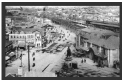
1925(大正14)年2代目駅舎 (所蔵：鉄道博物館)