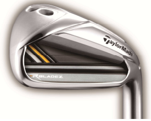
ROCKETBLADEZ™ MAX IRONS (2013年3月発売予定)