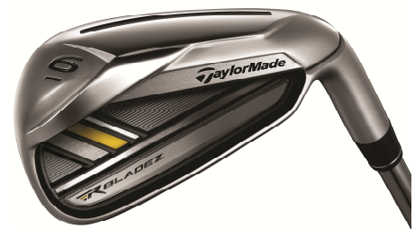
ROCKETBLADEZ™ IRONS (2012年12月発売予定)

『ROCKETBLADEZ アイアン』では、現代のゴルフクラブにおけるメタルウッドとアイアンの間にある“飛距離差”に着目、飛距離性能を追求して開発されたモデルです。メタルウッドが年々飛距離を伸ばす中、その飛距離差を埋めるべく誕生した同モデルには、『TaylorMade ROCKETBALLZ フェアウェイウッド(以下、RBZ フェアウェイウッド)』及び『TaylorMade ROCKETBALLZ レスキュー(以下、RBZ レスキュー)』に搭載されている「スピードポケット」構造をアイアンに初めて採用しました。