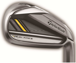
ROCKETBLADEZ™ IRONS (2012年12月発売予定)