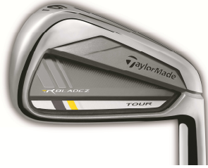
ROCKETBLADEZ™ TOUR IRONS (2013年2月発売予定)