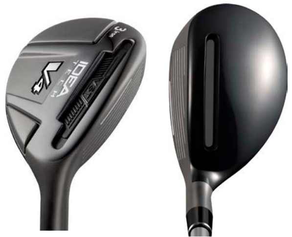
『Idea Tech V4 ハイブリッド』

『Idea Tech V4 ハイブリッド』は、“アイアンの扱いやすさ”と“フェアウェイウッズの飛び”の融合をコンセプトに開発されました。今回搭載された、クラウン部からソール部まで貫通した溝「カットスルーVST」は、ヘッド上下の溝で高い許容性を与え、易しく高弾道で大きな飛距離を実現する VST のコンセプトを発展させ、クラウンからソールを貫通させたテクノロジーです。クラウン側及びソール側それぞれのスロットは、TPU 製のバジで密閉し、これによりドライバー同様のフェース CT 値※ 1 をもたらすことに成功しました。またこのテクノロジーによってフェースに「スプリング効果」を生み出し、フェース全面にわたり、速いボールスピードとミスヒットへの高い許容性を与えています。さらに、複合素材構造を採用し、タングステンによる周辺重量配分で重心位置を適正に配置することにより、打ちやすさと高い打ち出し角を実現しています。