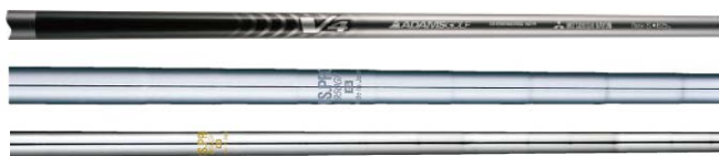
「Idea Tech V4 by MITSUBISHI RAYON CARBON」