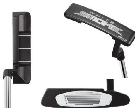
『WHITE SMOKE IN-12』