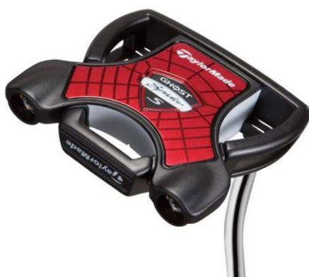
数量限定モデル『GHOST SPIDER S』 (2013年11月より販売開始)

テーラーメイドでは、新たに3モデルが加わったテーラーメイドパターシリーズを通じて、多くのゴルファーのあらゆるニーズに対応していきます。