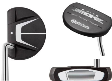
『WHITE SMOKE BIG FONTANA』