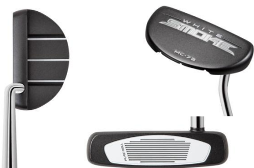
『WHITE SMOKE MC-72』