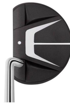
『WHITE SMOKE』ブラックバージョン Big Fontana (2013年11月より販売開始)