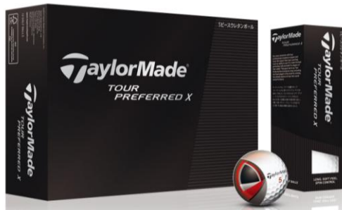
『TOUR PREFERRED X ボール』

テーラーメイドゴルフ株式会社(本社:東京都江東区/代表取締役社長:山脇康一)ではこの度、100名以上のプロが開発に携わり、飛びとスピンを向上させ、さらなる進化を遂げた5層構造のツアーボール『TOUR PREFERRED X (ツアープリファード エックス)ボール』と、4層構造の『TOUR PREFERRED (ツアープリファード)ボール』を2014年3月より販売開始します。