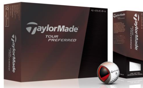
『TOUR PREFERRED ボール』

2013年度のPGAツアーにおいて使用率No.2を誇る『LETHAL(リーサル)』を、100人以上のプロからのフィードバックを元にさらに進化させたツアーボール『TOUR PREFERRED (ツアープリファード)ボール』シリーズは、新たに開発された「Soft Tech™(ソフトテック)ウレタンカバー」の採用により、多くのプロが求めるグリーン周りやアイアンショットにおける高いスピン性能を実現。さらに、テーラーメイドオリジナルのシームレス322ディンプルパターンが、乱気流の発生を抑え、風に強い弾道と飛距離性能を向上し、多様化するプロのリクエストを2つのタイプのボール『TOUR PREFERRED X ボール』、『TOUR PREFERRED ボール』で実現しました。