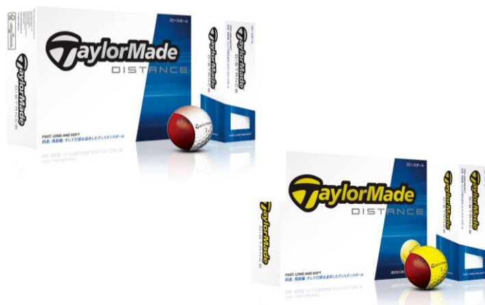
『TaylorMade DISTANCE ボール』

ディスタンス系2ピースボール『TaylorMade DISTANCE ボール』では、「Durable アイオタン™カバー」が耐久性に優れソフトフィーリングを実現。また、高い反発力で高初速を生み出す「REACT(リアクト)コア™」と、空気抵抗を抑制する「342 デンプルデザイン」との相乗効果により、大きな飛距離を生み出します。シンプルなホワイトとイエローの2カラーをラインナップし、リーズナブルでありながらもハイパフォーマンスな飛距離性能を提供します。