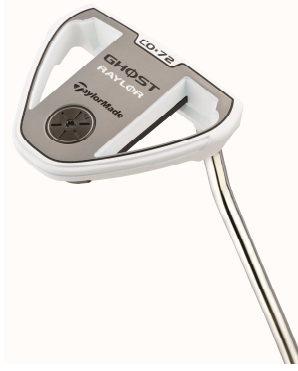
RAYLOR GHOST CO-72 with ADJUSTABLE SOLE WEIGHT