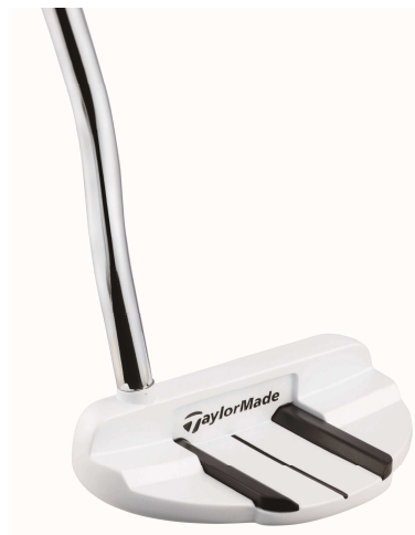
RAYLOR GHOST FO-72 with ADJUSTABLE SOLE WEIGHT