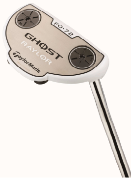
RAYLOR GHOST FO-72 with ADJUSTABLE SOLE WEIGHT