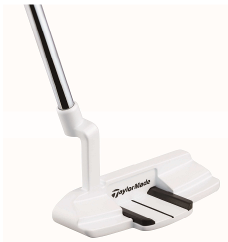
RAYLOR GHOST DA-12 with ADJUSTABLE SOLE WEIGHT