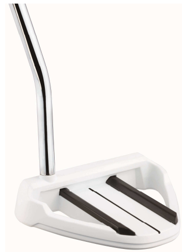
RAYLOR GHOST CO-72 with ADJUSTABLE SOLE WEIGHT